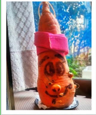
ひげおじさん 自家製にんじんアート